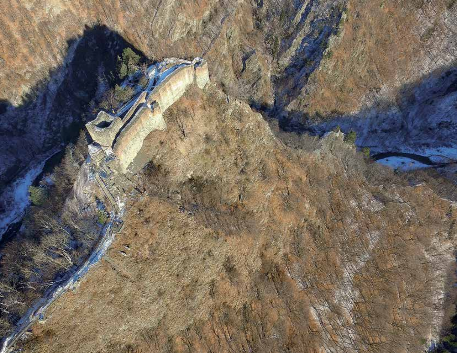
CETATEA POIENARI ÎN VEDERE AERIANĂ. (Sus)