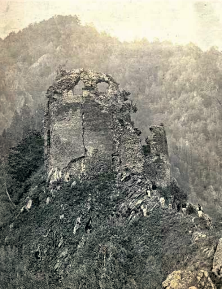
CETATEA POIENARI ÎNAINTEA PRĂBUȘIRII PARȚIALE A TURNULUI DE INTRARE (fotografie de Ion Niculescu, 1889, Biblioteca Academiei Române, București).